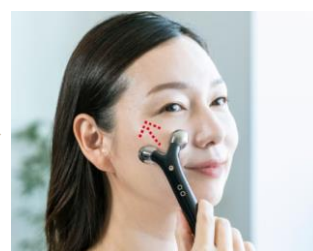
ピンポイントケア

狙った箇所をピンポイントで刺激できる WAVY mini for salon で仕上げ ※販路限定製品