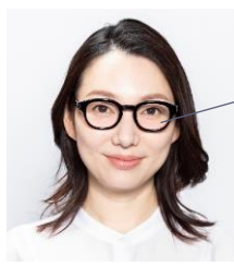
チークカラー®レンズ

太縁フレームは目元に強い印象を演出。さらに濃いカラーなら顔立ちを引き締めて見せ、小顔印象も。 UCF-22A-165 1986